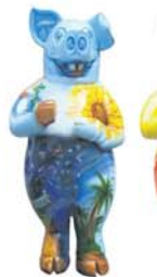
Wünsch Dir was