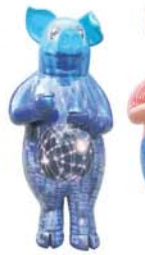
DANI - Das Dateutraufer-keil