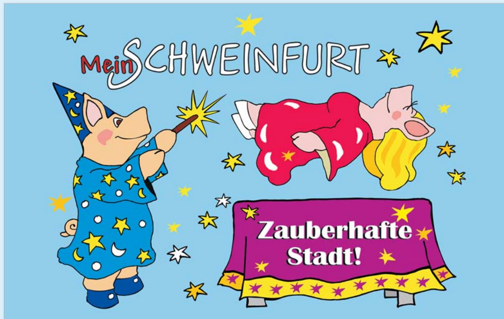
Illustration: Mirek Bednarsky