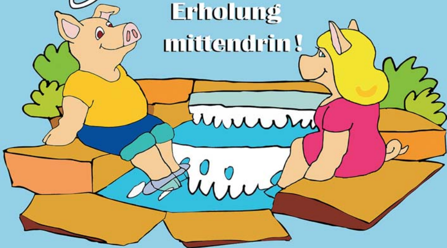
Illustration: Mirek Bednarsky