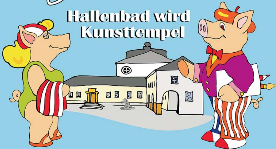
Illustration: Mirek Bednarsky