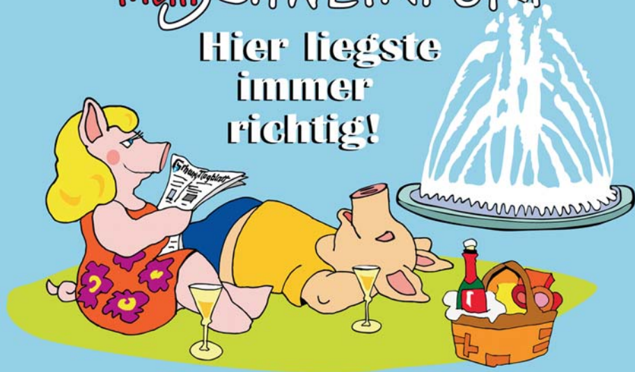
Illustration: Mirek Bednarsky