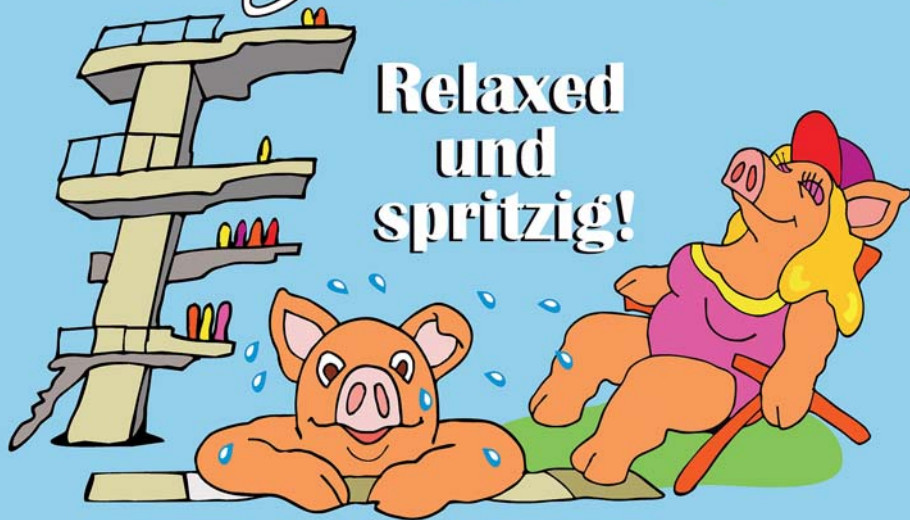
Illustration: Mirek Bednarsky