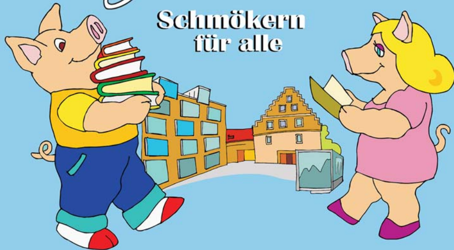
Illustration: Mirek Bednarsky