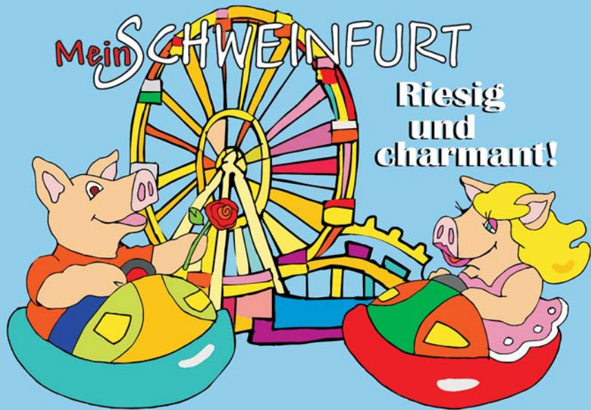
Illustration: Mirek Bednarsky