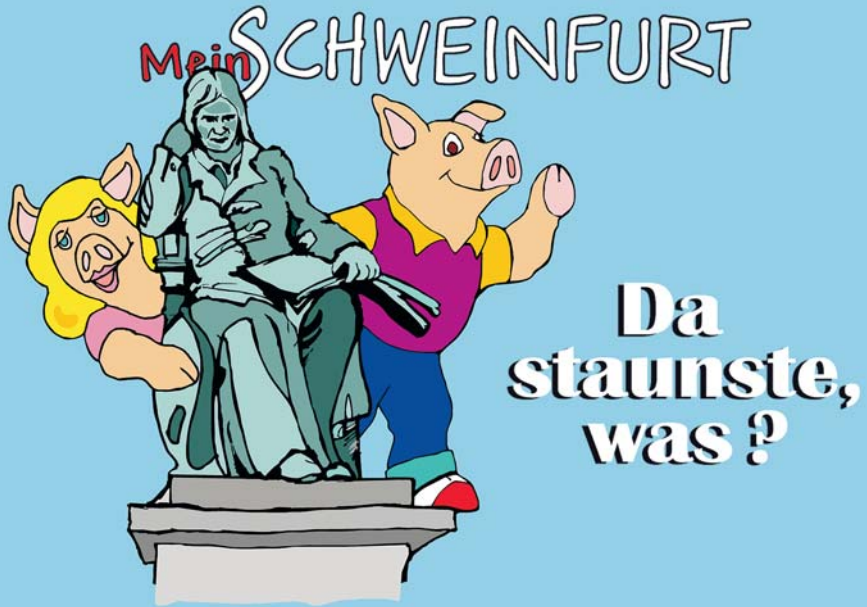
Illustration: Mirek Bednarsky